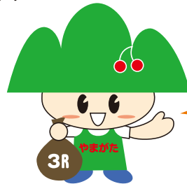
県運動キャラクター「ごみゼロくん」

食品ロス削減国民運動キャラクター「ろすのん」 ※食品ロス…食べられるのに捨てられてしまう食品